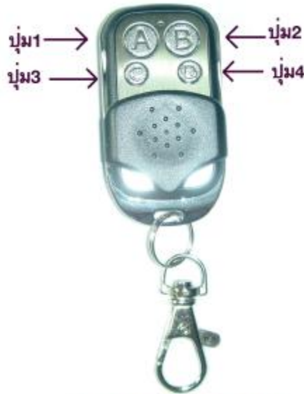
ตัวลูกรีโมท 4 สวิตช์ รุ่น CN