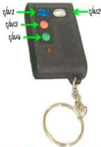
ตัวลูกรีโมท 4 สวิตช์รุ่นธรรมดา